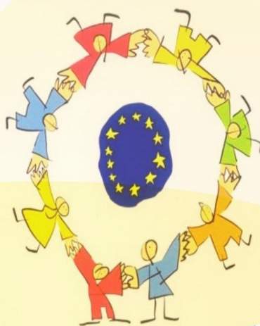
Фото поздрав към европейската общност на Инстаграм профила на Община Бургас